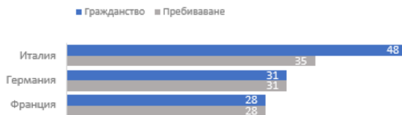
Графика1: Разпределение на организаторите по националност и пребиваване (трите водещи държави членки) (22)

Разпределението по възрастови групи (вж. графика 5 в приложението) показва балансирано представителство на различните възрастови категории с добро представителство на младите хора (21 % на възраст под 30 години и 50 % на възраст над 40 години).